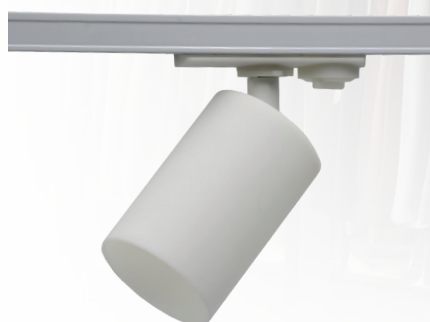
PTR 36 GU10 WH

Адаптер для подключения к однофазному шинному проводу является конструктивным элементом прожектора.