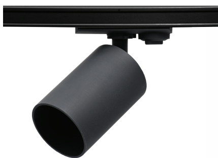
PTR 36 GU10 BL